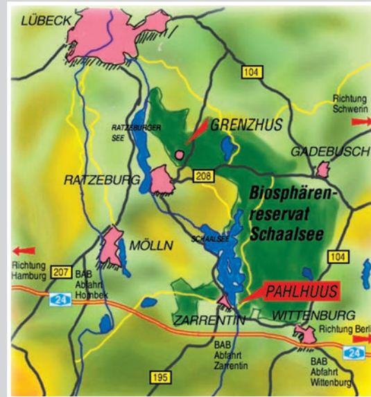
Lage Biosphärenreservat.

Das PAHLHUUS ist das Informationszentrum für das UNESCO-Biosphärenreservat Schaalsee. Sie finden es in der Wittenburger Chaussee 13, 19246 Zarrentin am Schaalsee.